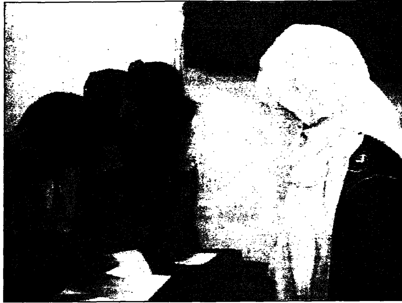
جزائريون في إحدى اللجان الانتخابية

الجزائر - من الأمين الخاصي وقد أقيمت الانتخابات التشريعية الجزائرية التي أعلنت الجمعة 19 يونيو 1997 في الجزائر العاصمة في تمام الساعة 10 صباحا بتوقيت الجزائر. وحصل على 155 مقعدا في البرلمان 19 حزبا من أصل 380 مقعدا. وحصل على 69 مقعدا 11 حزبا من أصل 380 مقعدا. وحصل على 69 مقعدا 11 حزبا من أصل 380 مقعدا. وحصل على 69 مقعدا 11 حزبا من أصل 380 مقعدا.